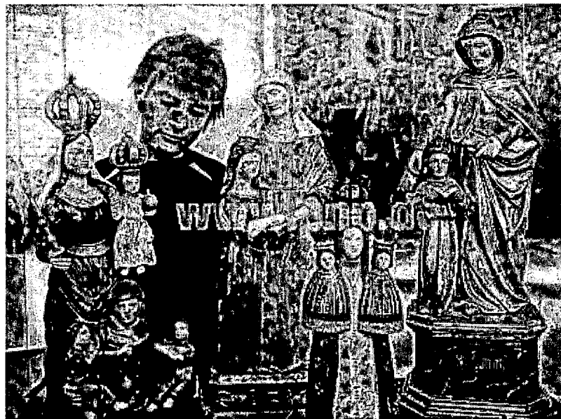
Insgesamt 120 geschnitzte Marien-Darstellungen und Hinterglasbilder gibt es bei einer Ausstellung bis zum 21. Juni im Freilichtmuseum Finsterau zu bestaunen.

Sammlung von Hannelore Wachsmuth noch bis 21. Juni im Freilichtmuseum Finsterau ausgestellt